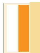
1/3 hoch* 73 x 297 1/3 hoch 55 x 264