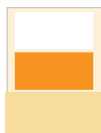
1/3 quer* 210 x 104 1/3 quer 174 x 84